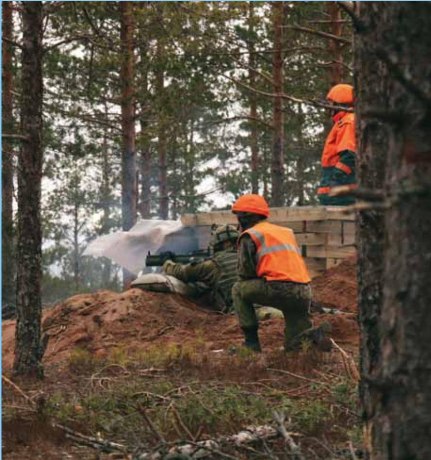
Kotimaan puolustus on ykkösasia. Työtä tehdään kansainvälisen koulutuksen kanssa rinta rinnan. Epäsuoran tulen koulutus keskitettiin Niinisaloon.