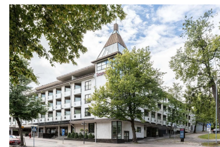
1989 valmistunut uusi Patria

Majoittuminen nykyaikaiseen hotelli Patriaan oli perjantain viimeinen virallinen osio. Siellähän sitä jo moni tapasikin lisää tuttuja koska Evp-yhdistyksen maltillinen siipi oli ottanut förskottia ja majoittunut jo runsaasti ennen H-hetkeä.