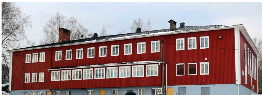
Vöyrin nuorisoseuran talo