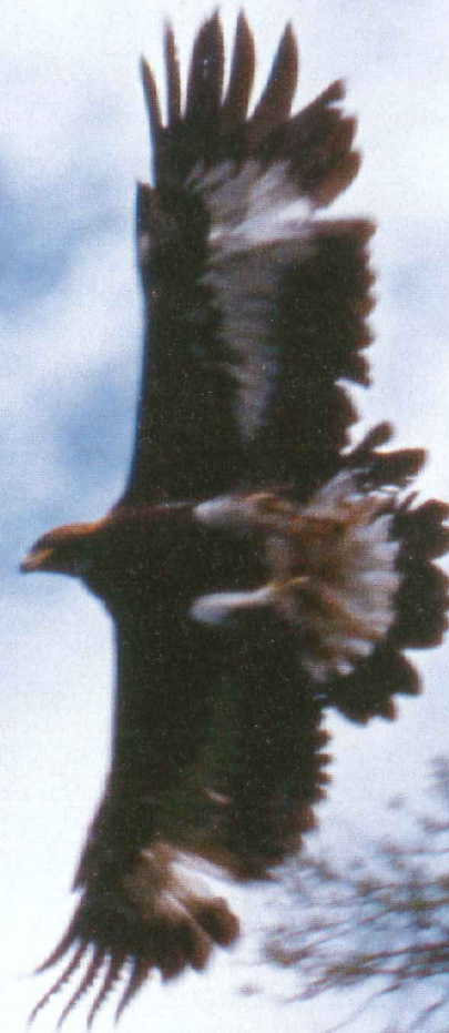
Maakotkan uljasta lentoa.

Kolmen opistoupseerin Wings – Nature Photog- raphy yhteisnäyttely Tikkakoskella kertoo hienol- la tavalla lintujen lentotaidosta. Keskeisessä osassa kuvissa ovat siivet ja lentäminen. Näyt- tely on avoinna koko kesän Keski-Suomen ilmailumuseossa.