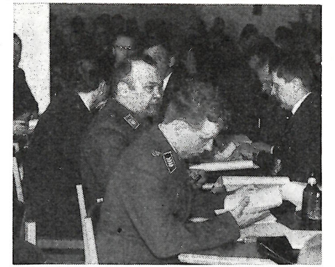
Vatjalan ja IlmavV:n kerhojen edustajia