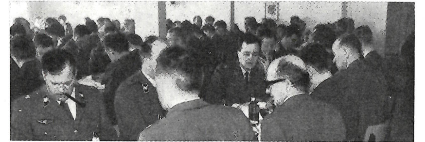
Pohjois-Karjalan piirin, Onttolan ja Kontiolahden kerhojen edustajat

tuksen edelleen tutkimaan jäsenkunnan lomanviettomahdollisuuksia ja antamaan selvityksensä vuoden 1970 liittokokouksen käsiteltäväksi.